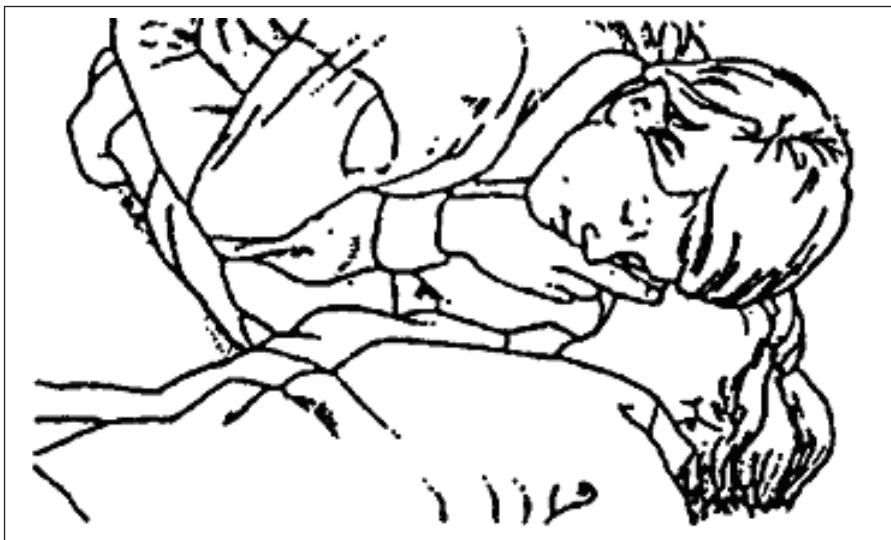
Obr. 1 Kontrola dýchání [čl. 6.2.2.2 b) a příloha B, čl. B.1 odst. e)]

Obrázky uvedené v této příloze názorně představují nejzávažnější akty poskytování první pomoci při úrazu elektrickou energií. V závorkách za názvy jednotlivých obrázků je vždy uvedena pouze jedna z kapitol Pravidel, k níž se vztahují. Popisy aktu poskytování první pomoci znázorněné na obrázcích jsou uvedeny přímo v textu Pravidel.